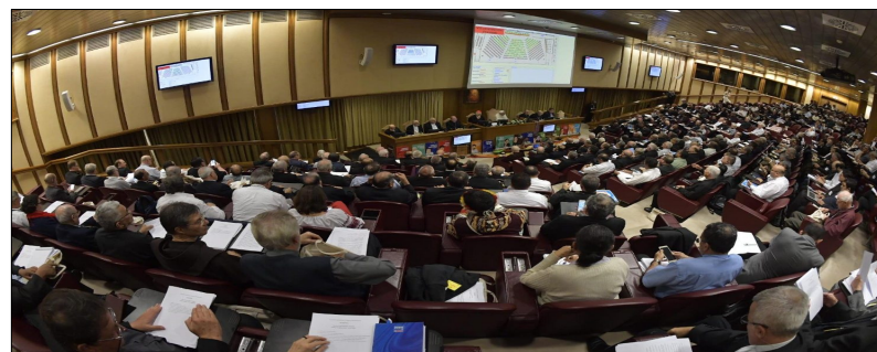
Aula bei der Amazonassynode

In den letzten Monaten war unsere deutsche Heimatkirche weltweit im Gespräch. Der Synodale Weg hat weltkirchlich große Erwartungen geweckt, aber auch Besorgnisse ausgelöst. Das Ringen um den richtigen Weg zur Erneuerung der Kirche steht in unserem Heimatland, wie auch der katholischen Weltkirche insgesamt, noch aus. Mitten in die zunehmende Polarisierung überraschte Papst Franziskus die aufgeheizte Debatte mit der Ankündigung einer Weltbischofssynode im Vatikan im Oktober 2022. Sie steht unter dem Thema „Für eine synodale Kirche: Gemeinschaft, Partizipation und Mission“ und ist als dreijähriger, weltweiter Prozess gedacht. Der Weg der Synode wird offiziell durch Papst Franziskus am 9./10. Oktober 2021 in Rom eröffnet und am Wochenende darauf in den Bistümern weltweit, bevor der Prozess in die eigentliche Bischofssynode im Oktober 2023 mündet