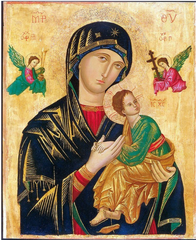
Maria von der Immerwährenden Hilfe, Rom Gnadenbild im byzantinischen Stil, Kreta, 14./15. Jhd.