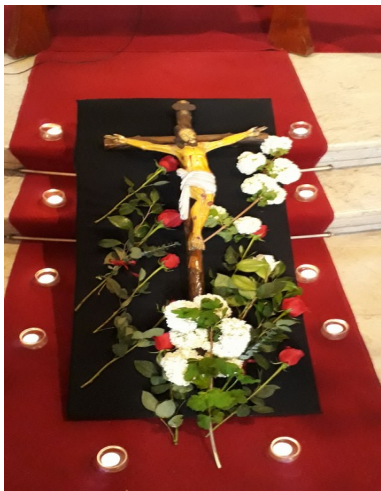
Karfreitag : Kreuzverehrung der Gemeinde