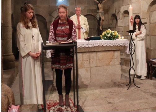
Ostersonntag : Ministrantinnen bei den Fürbitten