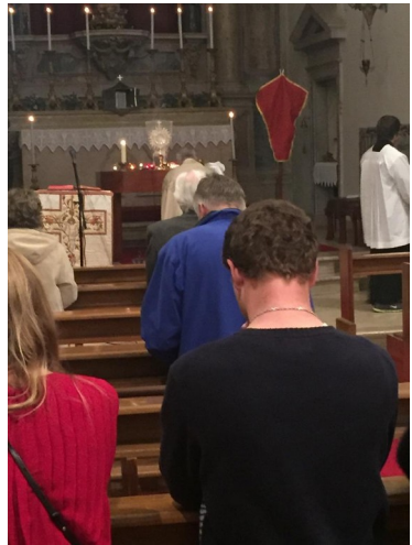
Gründonnerstag : Eucharistische Andacht