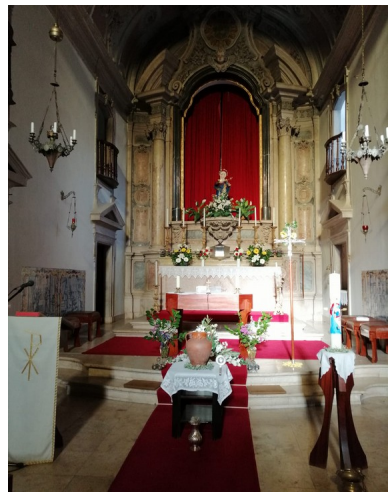
Ostersonntag : Festlich geschmückte Kirche