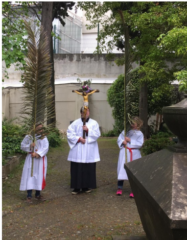
Palmsonntag : Statio auf dem ev. Friedhof