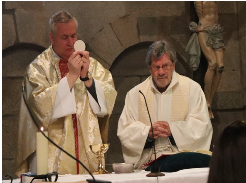
Ostersonntag : Vorgänger und Nachfolger bei der Festmesse