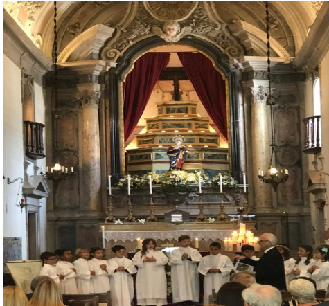
Erstkommunionkinder tragen Gebete vor

Es ist für die Kinder unserer Gemeinde vor allem ein wichtiger Schritt des Hineinwachsens in ihre Kirche. Wie in jedem Jahr wird dieses Ereignis von engagierten Gemeindemitgliedern mit großem Einsatz vorbereitet.